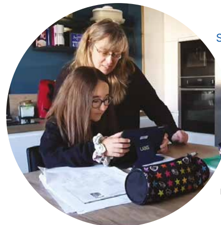
Services aux personnes (parrainé par la Fédération des Entreprises de Services à la Personne) ÉLANCOURT. ACCOMPAGNER LES PARENTS POUR ASSURER LA CONTINUITÉ PÉDAGOGIQUE NUMÉRIQUE

Chaque enfant du CP au CM2 (2000 familles) est doté d'une tablette numérique scolaire. Le confinement ayant mis en évidence la fracture numérique des parents dans l'usage de cet outil, la ville a mis en place un accompagnement individualisé pour former les parents qui ont pu ainsi aider leur enfant dans la continuité scolaire au domicile : un support téléphonique individuel, la création de tutoriels vidéo pour les familles dotées d'un ordinateur et sa version papier (seul budget investi). Cette situation a permis de mesurer le besoin des familles éloignées du numérique et amène à étudier, avec des enseignants, un projet d'« École numérique des parents » au sein même des établissements scolaires, dès la rentrée prochaine si les conditions sanitaires le permettent.