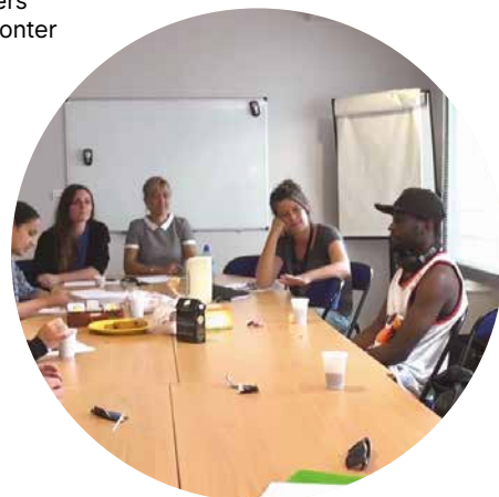
Revitalisation et innovation commerciales (parrainé par FDJ)

Alors que les parcours d'inclusion sociale manquent généralement de lisibilité pour les usagers et morcellent l'accompagnement proposé, le CEIS est un lieu d'accueil où les problématiques de logement, culture, précarité et autres ne sont pas fractionnées et où le citoyen est pris en considération pour lui redonner confiance, l'accompagner vers l'autonomie et l'aider à surmonter les difficultés. Ouvert en 2018 et accueillant un nombre croissant de participants, le CEIS est un tiers lieu numérique et social où les actions d'inclusion se déclinent autour de plusieurs plateformes : emploi, numérique, budget et santé, qui font appel à de nombreux partenariats et associent les citoyens à l'élaboration de projets.