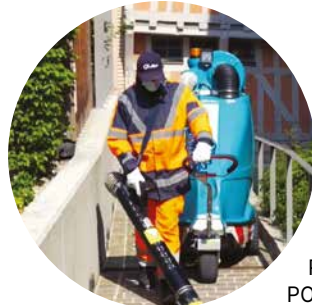
Prévention (Parrainé par SMACL Assurances et la MNT) TROYES. UNE UNITÉ DE RECLASSEMENT MUTUALISÉE POUR ACCOMPAGNER LES AGENTS INAPTES

Une unité de reclassement mutualisée est dédiée à l'accompagnement individuel des agents inaptes et une méthode à dynamique transversale permet d'accompagner le maintien dans l'emploi des agents et de les inscrire dans un processus de mobilité professionnelle, prioritairement sur des postes vacants. Plusieurs phases d'immersions peuvent être mises en place afin d'identifier la meilleure opportunité pour l'agent mais aussi pour le service. À l'issue du reclassement, l'agent continue de bénéficier d'un suivi trimestriel continu. Depuis la création de l'unité en 2018, 16 reclassements ont été pérennisés avec succès, dont 62.5 % sur des postes vacants et l'image des reclassements s'est clairement améliorée.