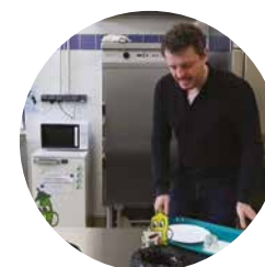
Territoires innovants (parrainé par Bouygues ES)

Le suivi des indicateurs et l'organisation d'ateliers antigaspi permettront de travailler sur les menus proposés aux enfants, en vue de réduire encore le gaspillage alimentaire. Un investissement important mais des subventions sont escomptées auprès du FEDER et de l'État.